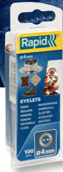
Rapid R5000409 T 32 40 12 Oogjes Ø4 mm