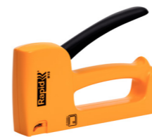
Rapid R20443950 (in blister)