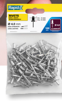
Rapid R5000378 Ø 4.0 ALU STAALLOS 140 60 Standaard blindklinknagels Ø4,0 x 8 mm, 100 stuks