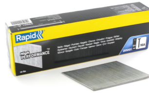
Rapid R5000821 T 16A 1540 6 Nagels 16A/64mm 20°, gegalvaniseerd, 2000x