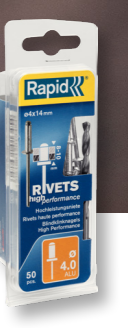
Rapid R5000385 Ø 4.0 ALU STAALLOS 90 15 Blindklinknagels Ø 4x14mm, aluminium, incl. boor