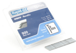
Rapid R40108178 T 32 190 5 Nagel 300/15, gegalvaniseerd, 900x