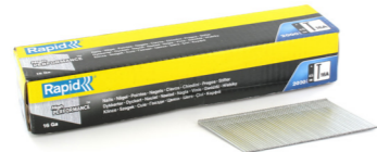
Rapid R5000819 T 16A 1330 6 Nagels 16A/45mm 20°, gegalvaniseerd, 2000x