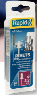
Rapid R5000383 Ø 3.2 ALU STAALLOS 50 15 Blindklinknagels Ø 3,2x8mm, aluminium, incl. boor