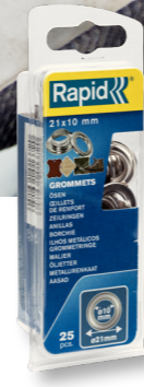
Rapid R5000412 T 32 120 12 Zeilringen Ø21 x 10 mm, 25 stuks